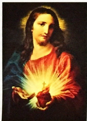
Pompeo Batoni, 1763

rita, diversas imágenes de corazones comenzaron a proliferar, por lo que la iglesia asumió el control de la producción iconográfica y prohibió la producción de corazones aislados (el dibujo de corazones sueltos como emblemas), lo cual generó la aparición definitiva de representaciones del Corazón acompañando figuras sacras como la del Niño Jesús y María o la de san